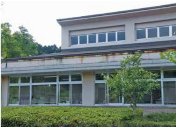
老朽化する保健福祉センター