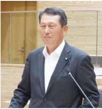
その部 菌部 一 議員