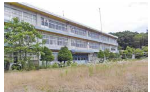
廃校と荒れたグラウンド