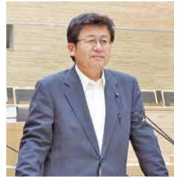
あくつ のりお 議員 阿久津 則男