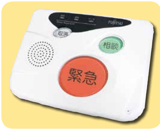
緊急通報システム

町長 緊急通報システムの設置状況は近隣市町に比べても多い。導入待ちの方は、返却された機器を引き継いでいただく。配食サービスの現在の利用者は144名。200円と低廉なのでこの料金でやっていく。