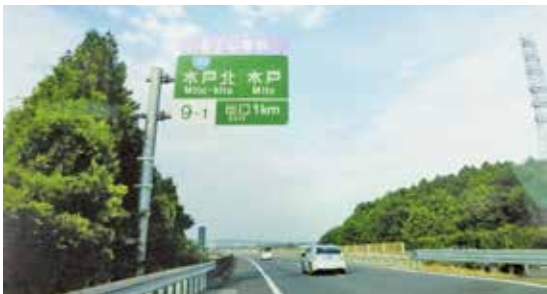
水戸北インター出口標識