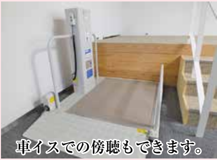
車イスでの傍聴もできます。

日程など詳しいことは議会事務局またはホームページでご確認ください。 TEL. 029-288-3111 (内線302) http://www.town.shirosato.lg.jp