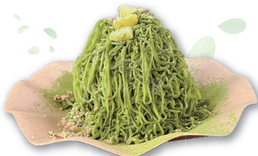
古内茶モンブラン

古内茶を粉末状に加工し、贅沢に使用した一品。甘みと渋みのバランスが絶妙で、口に入れた瞬間に上品で豊かな風味が広がります。鮮やかな緑色も美しく、見た目にも楽しめるスイーツです。歴史ある古内茶の魅力を、ぜひご堪能ください。