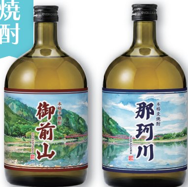
芋焼酎 「御前山」 麦焼酎 「那珂川」

これらの焼酎に使われている水は、県立自然公園特別地域に登録されている御前山から流れる天然水を使用しています。最大地下 50 メートルから汲み上げた希少で清らかな天然水を使用することで、城里町にしか作れない特別な芋焼酎「御前山」と麦焼酎「那珂川」を仕上げました。