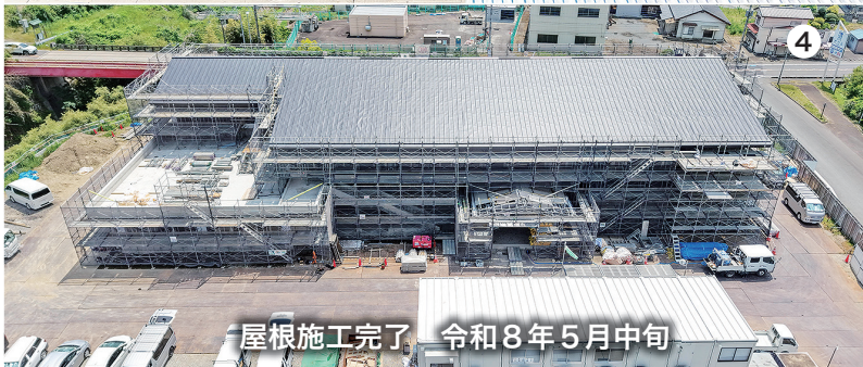
屋根施工完了 令和8年5月中旬