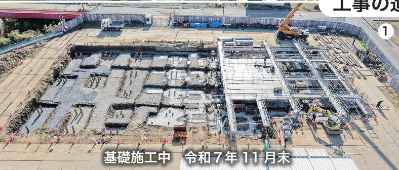
基礎施工中 令和7年11月末