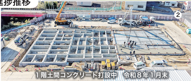
1階土間コンクリート打設中 令和8年1月末