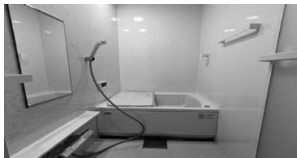
△ユニットバスの浴室