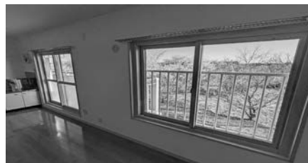
△断熱サッシ(ペアガラス化) ※室内すべての窓に適用