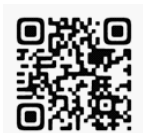
<水道カフェの様子はこちら>

利き水体験、大学生や専門学校生による展示案内、水道クイズなど楽しみながら水道を知ることのできる企画を実施しました。令和6年度の様子は動画でも公開しています。