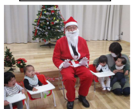
キャンドルサービス