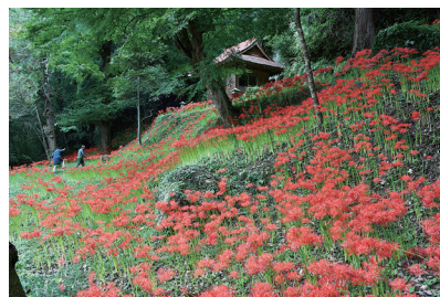
壁面観音の彼岸花