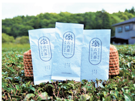
▶茨城三大銘茶 古内茶

綿引 最近、若者たちが議会、特に国会に興味を示し始めていると感じる。それは、SNSを通して正しい情報を得た人たちが、将来の日本の