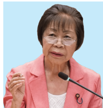
ふじさく ふみこ 議員 藤咲 芙美子