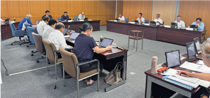
予算・決算常任委員会1日目の審査状況