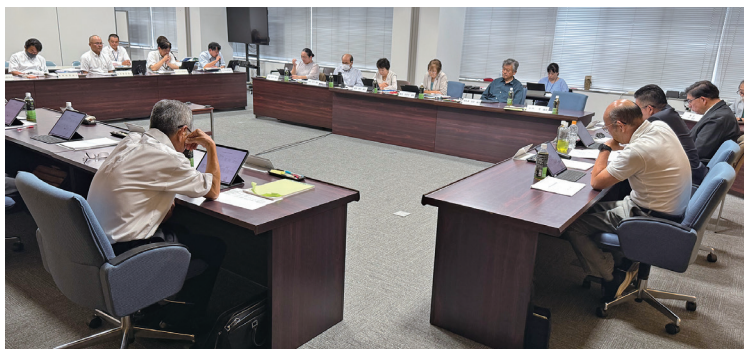
予算・決算常任委員会2日目の審査状況

令和6年度一般会計決算の教育産業常任委員会所管分・水道事業会計・下水道事業会計の決算について審査しました。