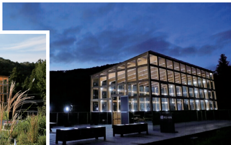
▲ KU-AN ー空庵ー(常陸太田市)

町長 7月に赤沢富士周辺三か所の眺望改善を行った。県や関係部署とも連携を強化し整備を進める。