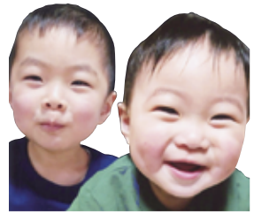
お兄ちゃんと仲良く、元気に 笑顔で大きくなってね。