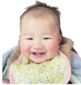
いつも甘えん坊でニコニコな まつりちゃん。元気いっぱい 育ってね。