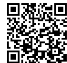
▲国税庁ホームページ

マイナンバーカードとスマートフォン(マイナンバーカード読取対応)があれば、確定申告会場に向くことなく、国税庁ホームページ「確定申告書等作成コーナー」を利用して確定申告を行うことができます。ぜひ、ご利用ください。