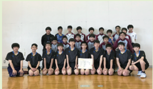
▲男子：準優勝 常北中学校