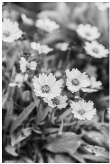
▲オオキンケイギク

処分方法 種が飛散しないよう、根から引き抜いてください。抜き取った株はビニール袋に入れて密封し、燃えるごみとして処分してください。