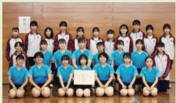
▲女子：準優勝 常北中学校