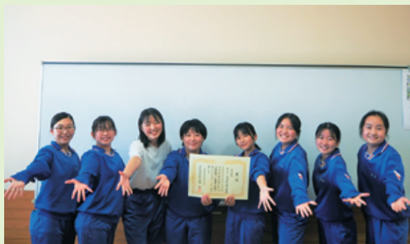
▲女子：第3位 桂中学校

日頃の練習の成果を発揮し、白熱した試合を展開しました。町内の中学校の主な成績は次のとおりです。