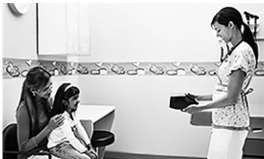
▲カメラのような検査機器です