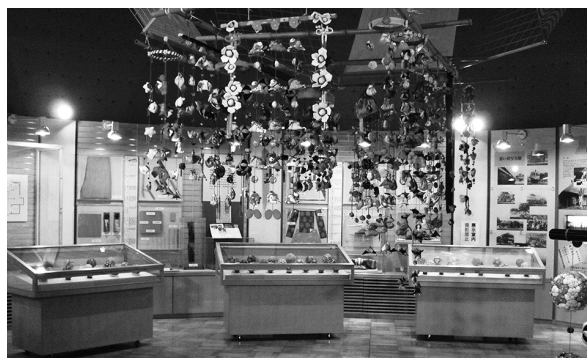
▲過去の展示会場の様子