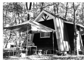
▲ふれあいの里宿泊利用券