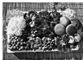
▲きのこの詰め合わせ