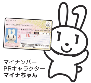
マイナンバー PRキャラクター マイナちゃん

令和3年10月から、準備の整った医療機関や薬局などで、マイナンバーカードを健康保険証として利用できるようになりました。