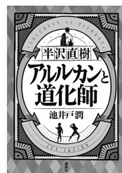
池井戸 潤 著

東京中央銀行大阪西支店の融資課長・半沢直樹のもとに、大手IT企業が業績低迷中の美術系出版社を買収したいという案件が持ち込まれる。半沢は大阪営業本部の強引な買取工作に抵抗するが、背後にひそむ秘密の存在に気づき…。