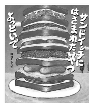
岡田 よしたか 著

おにぎりの具になれなくて、がっかりしていた食べ物たち。おにぎりがダメなら、パンにはさんでサンドイッチにしてもらおうと、閉店後のパン屋にしのびこんだ。みんなで食パンにはさんでもらって…。