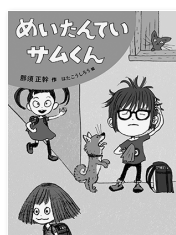
那須 正幹 作絵 はた こうしろう

タケシクんのうわぐつはどこにいった？公園で消えた人形のなぞとは？ハルミさんはなぜのらい又に追いかけられる？難しい事件はめいたんていサムくんにおまかせ！空色のハンカチと頭脳で、今日も事件を解決！