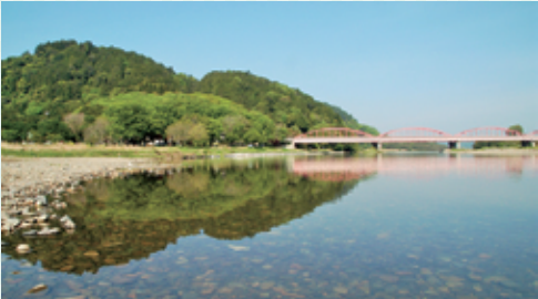
▲「関東の嵐山」御前山と清流那珂川

また、那珂川大橋は昭和24年に建設され、完成から70年が経過し、架け替えが検討されています。事業主体である県は、「道の駅かつら」を通るルートを最適案と示しており、「道の駅かつら」が県の橋梁事業と一体となって新しく生まれ変わる好機となります。