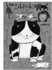
文絵 著 洋範 文絵 杉浦 文絵

もとは飼いねこだったけれど、飼い主が引越してしまえば、今はノラねこのブッチー。そんなブッチーが「文字をならおうかな」と言い出し…。さらに成長したルドルフとブッチーたちが大活躍する「ルドルフシリーズ」第5弾。