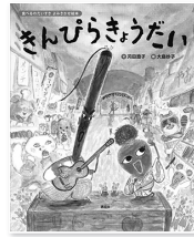
文絵 著 澄子 文絵 大島 文絵

ごぼうとにんじんは「きんぴらきょうだい」と呼ばれるほど、大の仲良し。ふたりの願いは「きんぴら」になること。料理してもらおうと、みんなの家をたずねるけれど…。食べものの楽しいよみきかせ絵本。