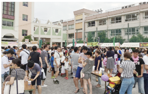
▲多くの来場者で賑わう会場