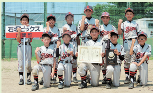
▲準優勝 石塚ビックス野球スポーツ少年団

石塚ビックスは3試合勝ち進みましたが、決勝戦で惜しくも敗れ、準優勝になりました。