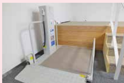
車いすでの傍聴も出来ます。