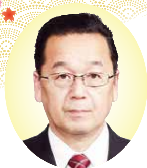
副議長 関 誠一 郎