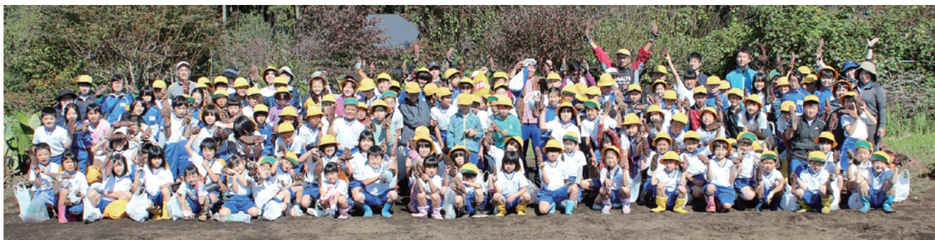
つくしの会の方々と共に(サツマイモ掘り)