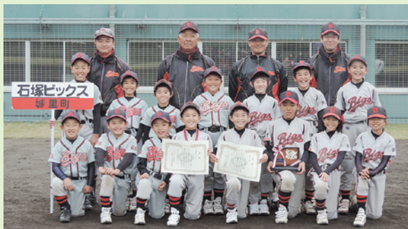
▲第3位 石塚ビックス野球スポーツ少年団