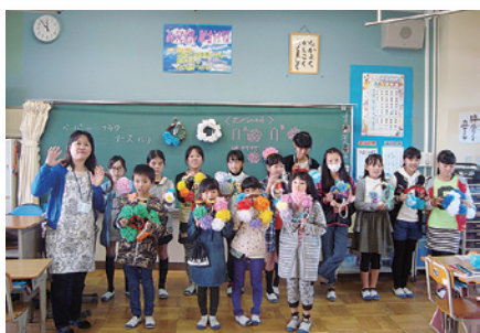
ペーパーフラワー