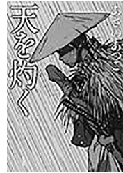
著 あさの あつこ

父は切腹、所払いとなつた天羽藩上士の子・伊吹藤士郎は、蘭草田が広がる僻村の大地を踏み縮める。過酷な運命を背負った武士の子は、何を知り、いかなる生を選ぶのか?