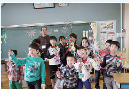
ペットボトル風車