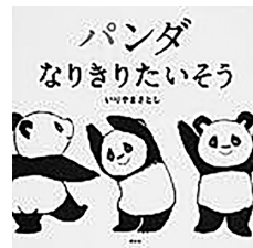
作 いりやま さとし

なりきりたいそうはじめるよ。りょうてをうえにあげて、ぐーんとおびて。チュリップ、バナナ、ひこうき、おにぎり…。さあ、つぎはなにかな? ページをめくると、パンダたちがだいへんしんします。