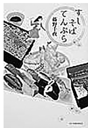
著 藤野 千夜

テレビ番組でお天気お姉さんをしている寿々は、ブログ「江戸まちめぐり」を開設することになった。 一緒に住むおばあちゃん「江戸の味」を求めて浅草、日本橋、神田へ…。