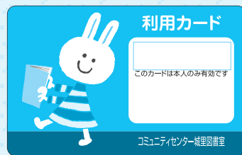
▲新しい共通利用カード

コミュニティセンター城里図書室のカード(ホロルのイラストが入った数字7ケタのもの)のみお持ちの方は、新たに利用登録が必要になります。コミュニティセンター城里図書室で登録できますので、運転免許証など住所、氏名等が確認できるものをご持参ください。