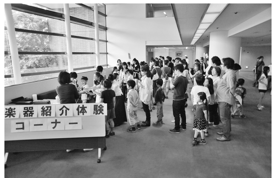
▲楽器紹介・体験コーナーの様子

問合せ コミュニティセンター城里 ☎029-288-6100 受付時間：午前9時～午後5時※月曜休館