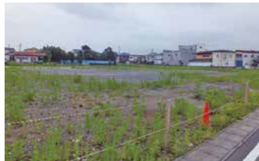
更地になった城北病院跡地