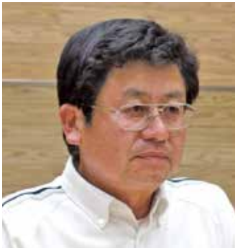
あくつ のりお 議員 阿久津 則男