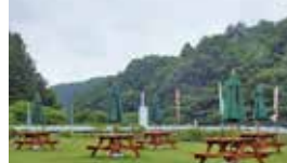
経営の改善に努めている山桜