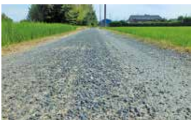
防塵舗装された町道