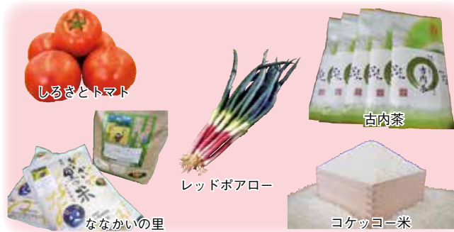
町で生産される優良農産物

町長 国の政策に従って飼料米の促進を行うだけでなく、町の中にある優良農産物の販売促進にも努め、特に最近ふるさと納税が各自自治体工夫を凝らしており、城里町でもふるさと納税の申し込みがインターネット、クレジットカードでも出来るよう体制の整備を進めている。