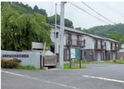
塩子塙団地の賃貸住宅

阿久津 10億近く注ぎ込んだこの山林に企業から太陽光発電の事業の申し込みがあり町に税収等が20年間で12億3千万円プラス39haの土地代が見込め、更に雇用もあるというチャンスを取り消したが町の財政力を考え行動しているのか。 町長 総務民生常任委員会に台風や豪雨時の出水被害の増大懸念があるので売却しないと申し上げた。 阿久津 国からの地方交付税が5年間で9億円減額される予定で自主財源確保が必要だが39haの山林はこのままの状態にしておくのか。 町長 財政が非常に厳しいという指摘は真摯に受け止め必要のある事業にお金をかけ効果が少ない事業については整理