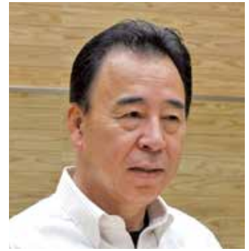
杉山 清 議員