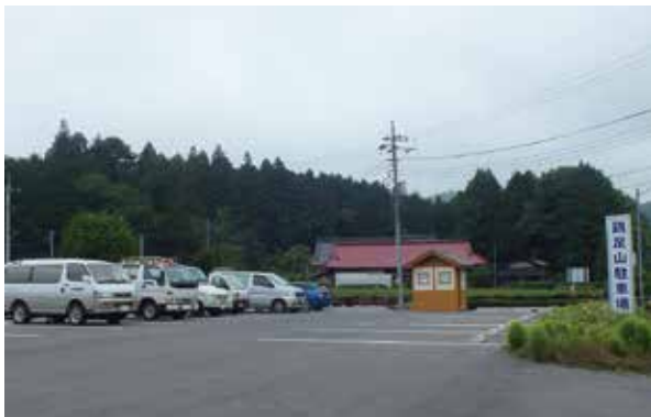
夜間照明のない鶏足山駐車場

町長 鶏足山駐車場の夜間照明については、今後の対策として地域の方の意見をいただき検討を進めたい。