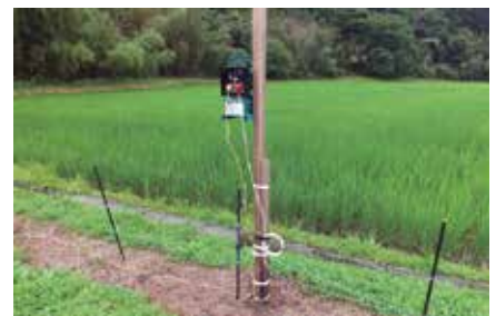
水田に設けられた電気柵

町長 農産物の被害防止のため電気柵、防護柵の購入補助として、農業共済より3万円を上限として補助があり、来年度の課題と