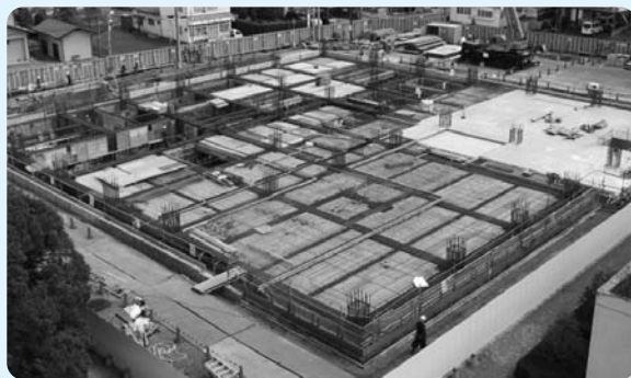
▲4月中旬／1階床・梁のコンクリート打設工事