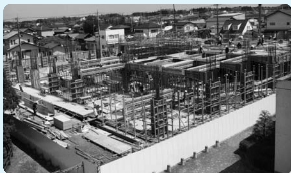
▲4月下旬／1階柱・2階床・梁の配筋工事