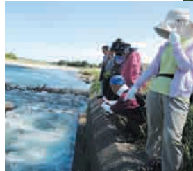
▲若鮎の遡上する様子を見学