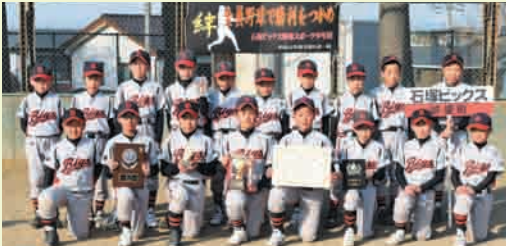
優勝 石塚ビックス