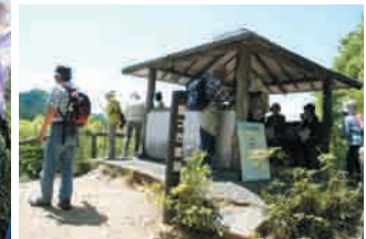
▲見晴らし台「鐘つき堂跡」でちょっと休憩