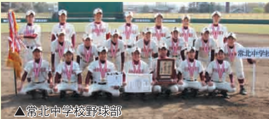
▲常北中学校野球部

大会には、県内から選抜された24校が出場。常北中学校は準々決勝で完全試合を成し遂げるなど、安定した技術とチームプレーを披露しました。