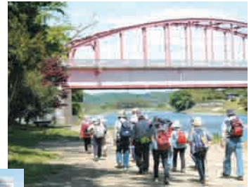
赤い橋で知られる「那珂川大橋」の下をくぐって御前山登山口へ▶

今回は町内外から約50人が参加し、コースの要所で出題されるクイズに答えながら約1時間半の散策を楽しみました。また午後からは、希望者を対象にアユの遡上する那珂川を散策したり、木工芸を楽しんだりして春の御前山と那珂川の自然を満喫しました。