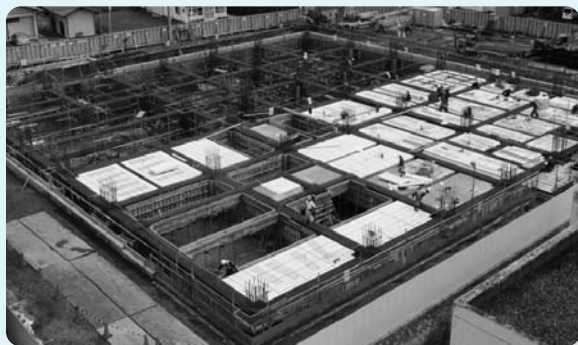
▲4月上旬／1階床・梁の配筋工事

平成26年4月に1階床の工事が完了し、1階柱、2階の床・梁の配筋工事を行っています。