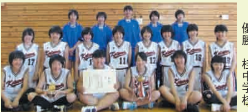
女子の部 優勝 桂中学校