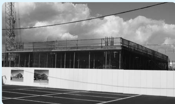
▲コミュニティセンター前駐車場から撮影