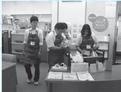
▲返却された本を仕分けする水戸桜ノ牧高等学校常北校の生徒

夏休み期間中、県立水戸桜ノ牧高等学校常北校から4名、常北中学校から4名、桂中学校から2名の生徒が2日または3日間の日程で、図書館の仕事を経験しました。カウンターでの資料の貸出や、戻ってきた資料の棚への返却、傷んだ本の修理や図書整理など、初めての仕事にとまどうこともあったようですが、一生懸命取り組んでいました。