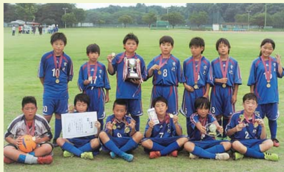
▲優勝 常北サッカースポーツ少年団

この大会において常北サッカースポーツ少年団が高学年（小学6年生以下）の部で見事優勝しました。