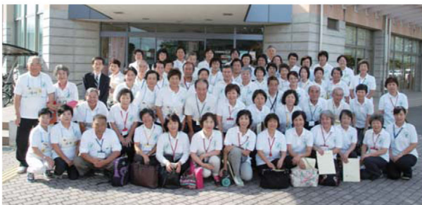
▲みんなで一緒に記念撮影

交流会では、シルバーリハビリ体操をしながら互いの指導法を学んだり、グループごとに分かれてそれぞれの活動内容を話し合ったりしながら、和やかな雰囲気の中で情報交換が行われました。