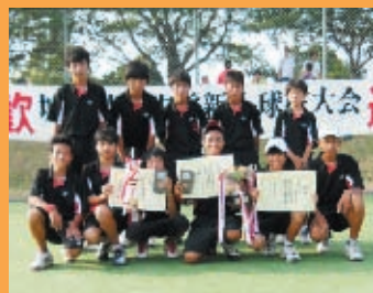
準優勝 常北中学校