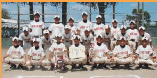
準優勝 常北中学校