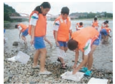
▶ 網を使って、那珂川に生息する水生生物を捕獲し、観察しました。

参加した生徒からは、「川がニや魚を採れなかったのが残念」、「思っていた以上に川の水がきれいだった」などの感想が聞けました。