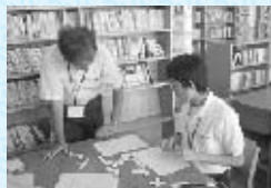
「ペントミノ~正方形の不思議」