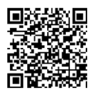
雨量・水位情報 携帯電話用 QRコード