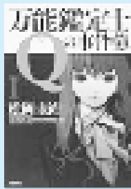
松岡 圭祐 角川書店

都内に異常増殖した力士シールの怪、ニセ札大量発生によるハイパインフレの危機。記憶と照らし合わせて瞬時にあらゆる物の価値や真贋を判定する、万能鑑定士・凜田莉子が、そのすべての謎を見抜く！