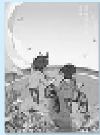
有川 浩 角川書店

とある県庁に突如生まれた新部署 おもてなし課。観光立県を目指すべく、若手職員の水掛は、地元出身の人気作家に観光特使就任を打診するのだが…。