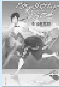
本宮 条太郎 実業之日本社

千葉湾岸市の観光事業課に勤務する由香は、突然「市立水族館アクアパーク」に出向を命じられる。イルカ課に配属になり、徐々に仕事を覚えていくが、イルカが突然病気を発症して…。新米イルカ飼育員の青春お仕事ノベル。