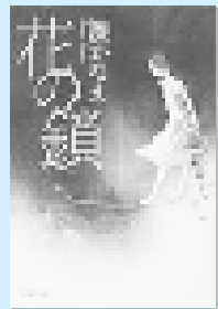
湊 かなえ 文藝春秋

元英語講師の梨花、結婚後子供ができて悩む美雪、絵画講師の紗月。そして、3人の女性の人生に影を落とす謎の男「K」。感動のミステリー！