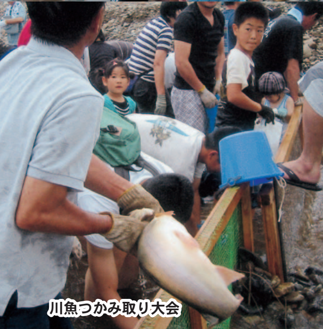
川魚つかみ取り大会