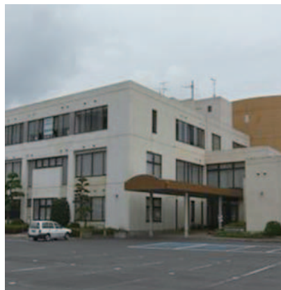
(コミュニティセンター城里)