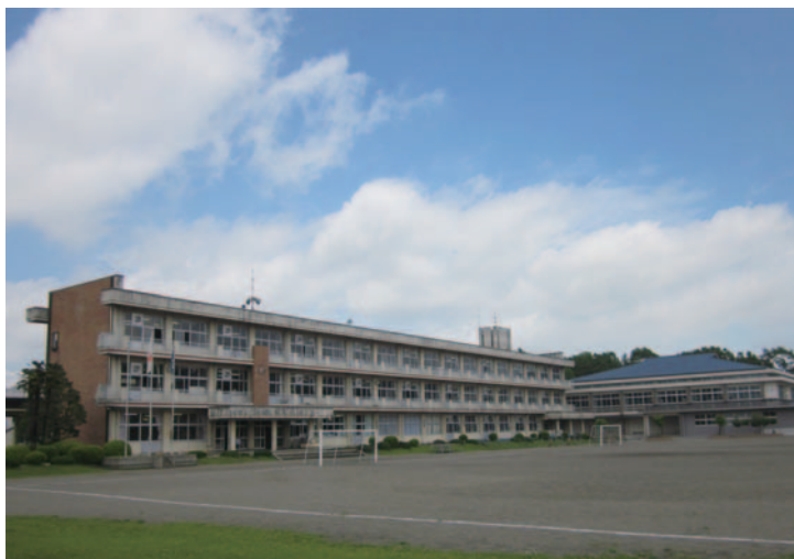
(着工前の石塚小学校)

契約の相手方 株木・東海組特定建設工事 共同企業体 契約金額 124,425,000円