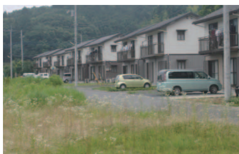
(塩子塙団地 七会地区)