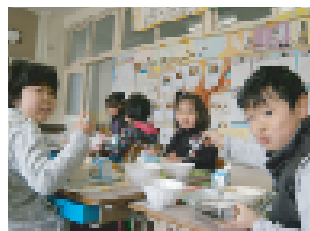
◀ すいとん とってもおいしいね!