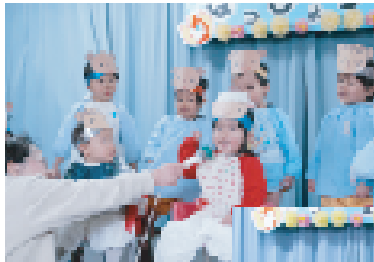
▼ダンスも上手に踊れたよ

児童たちのかわいらしい演奏やダンスに、訪れた保護者たちからは大きな拍手が送られました。