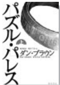
ダン・ブラウン 角川書店

パズルパレス上・下 史上最強の米情報機関・NSA、別名パズル・パレスのスーパーコンピュータが狙われた。全通信を傍受できるこのコンピュータの存在は、第1級の国家機密であった。情報化時代のテロリズムをスリリングに描く。