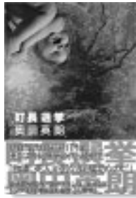
奥田英朗 文芸春秋

町長選挙 離島に赴任した精神科医の伊良部。そこは、島を二分して争われる町長選挙の真つ最中だった。伊良部もその騒動に巻き込まれてしまふ。「空中ブランコ」「イン・ザ・プール」でお馴染みの、トンデモ精神科医の暴走ぶり健在!