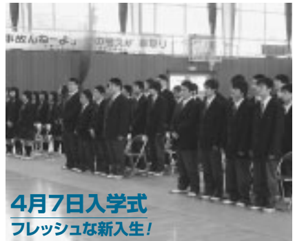
4月7日入学式 フレッシュな新入生!