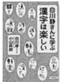
白川静 共同通信社

漢字学の第一人者が、漢字の成り立ちや体系を楽しく教える一冊。関連性のある漢字を具体的に挙げながら、その古代文字の形、イラストなどを多用して、漢字の体系性を子供から大人までにわかりやすく紹介する。