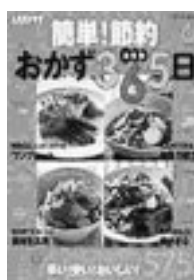
削SSコミュニケーションズ

春は萌えいずるいのちを、夏はものたちの生気を、秋は実りの滋味を、そして冬は耐える力を。季節の移ろいとともに変化する四季折々の料理を、日本人の食に対する感性の素晴らしさを説きながら紹介する。