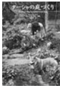
ターシャ・トゥーダー メディア・ファクトリー

ターシャの35年間の庭づくりの経緯やノウハウを、たくさんの写真と共に紹介。2006〜2007年の、成熟したターシャの庭も撮影。切り取って飾れる、ターシャが描いた「家の全景と石積み」の図面」付き。