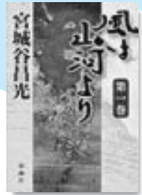
宮城谷昌光 新潮社

戦国前夜の奥三河。野田城主・菅沼新八郎定則は、瞬く間に西三河を統一した松平清康の驍名を聞き、卓越した判断力で帰属する今川家を離れる決意をする…。中国歴史小説の巨匠が初めて挑む戦国日本。