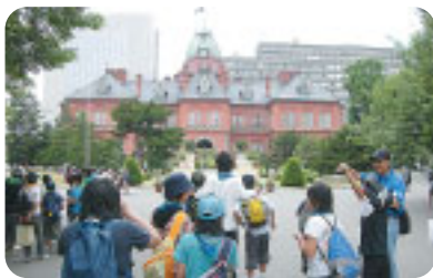
仲間たちとともにボランティア活動をして みませんか！ （ふれあいの船札幌散策旧道庁前にて）

毎月第2土曜日午後2時から常北公民 館会議室で 定例会を開 いていま す。興味が ある方は、 お気軽に参 加してくだ さい。お待 ちしていま す。