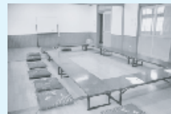
▲フローリング、踊り等練習可能