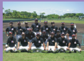
優勝 桂コンドルズ