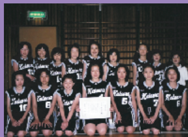
◀準優勝した桂ミニバススポーツ少年団

優勝 みどりミニバススポーツ少年団 準優勝 桂ミニバススポーツ少年団 第3位 羽鳥ミニバススポーツ少年団