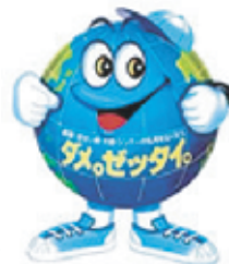
(財)麻薬覚せい剤乱用防止センター マスコットキャラクター 「ダメ。ゼッタイ。」君