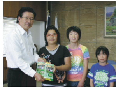
役場にもお茶をいただきました！

収穫したお茶は製茶の後古内小のパッケージが施され、役場や駐在所等、町内の施設に配られました。