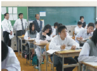
▲1年生の授業を見学

6月11日(木)第1回学校評議員会を開き、授業参観に続いて協議を行いました。「落ち着いた授業だ」「常北高校ならではのPRを」等の感想やご意見をいただきました。