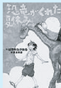
はやみねかおる 講談社