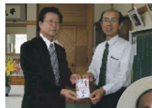
▲阿久津町長と 後藤校長