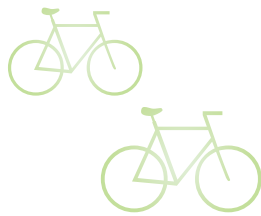
▼沢山小学校 選手の皆さん