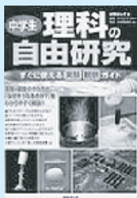
山田ふしぎ 成美堂出版

コーラを大噴火させる方法、3色焼きそばの作り方、紙コップと糸で楽しむ楽器演奏など、自由研究を面白くする実験・観察のやり方を紹介し、「なぜそうなるのか？」をわかりやすく解説する。