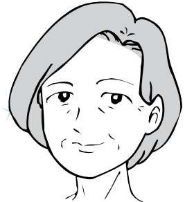
長年喫煙した場合

長年タバコを吸い続けると実際の年齢以上に肌の老化が進んでしまいます。女性だけではなく、男性の場合も喫煙者は実際の年齢と見た目の年齢に差が出やすくなります。