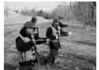
昨年の林野火災防御訓練

3月1日～7日は春季全国火災予防運動期間です。期間中の3月1日(日)、午前9時30分より、七会中学校周辺において水戸市消防本部、水戸市消防団及び城里町消防団による水戸市・城里町合同林野火災防御訓練を実施します。訓練内容は遠距離・高低差中継送水訓練等を予定しています。