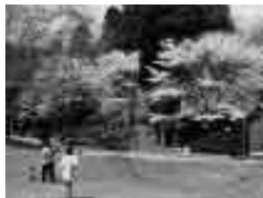
昨年のさくらまつりの様子

イベント内容(土日のみ) ビンゴ大会、さくらもち作り、ピタパン作り、手打ちそば・うどん・おにぎり等の販売