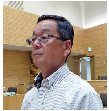
せいき せいいちろう 議員 関 誠一郎