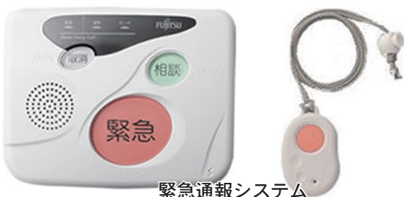
緊急通報システム

今後、携帯電話だけという人も増えてくると考えるが、携帯電話でも使用できるように改善できないか。