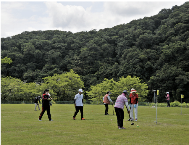
ホロルの湯 グラウンドゴルフ場