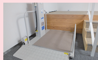
車いすでの傍聴も出来ます。

第2回定例会（6月8日～15日まで開催）合計39人 なお、新型コロナウイルス感染拡大防止のため、議場での傍聴人の定数を1日あたり15名とさせていただきました。