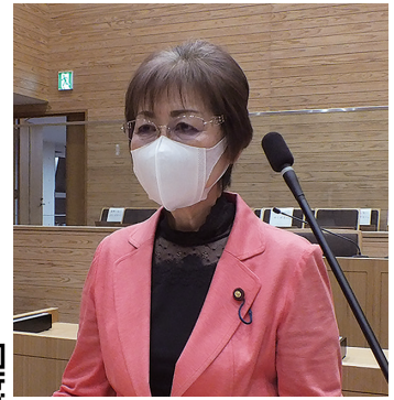
ふじさく ふみこ 議員 藤咲 芙美子