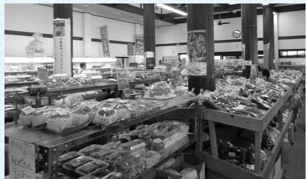
▲品揃え豊富な店内

問合せ 物産センター山桜(城里町小勝80) ☎0296-88-2300 🌐 https://www.yamazakura.shop/