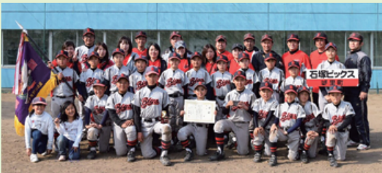
▲優勝 石塚ビックス野球スポーツ少年団

県内外36チームが参加して開催された上記大会において、石塚ビックス野球スポーツ少年団が優勝しました。