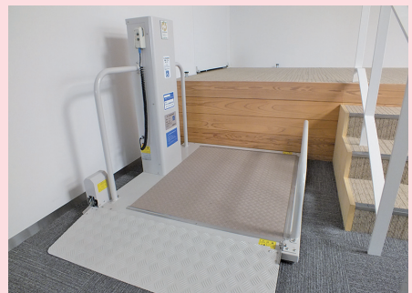
車いすでの傍聴も出来ます。