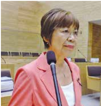
藤咲 芙美子 議員