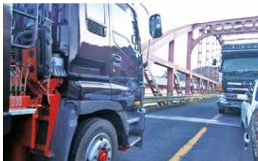
交互通行の那珂川大橋