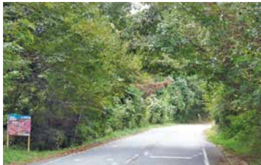
ビーフライン（小勝地区）の様子（10月撮影）