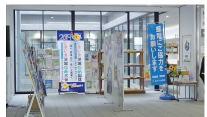
総合案内があった場所には、現在パンフレット等が置かれている