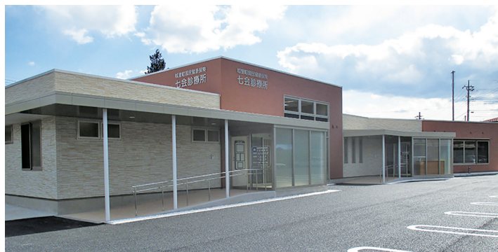
6月1日から移転、診療開始しました。

区も診療圏と考える。 片岡 訪問介護サービスについて、介護する家族が1〜2時間介護の手が離れる事で心のリフレッシュ、介護離職等を防止するには。 町長 平成12年にスタートした介護保険制度で、在宅のまま受 けられるサービスとして、訪問介護、訪問医療介護、併せて12のサービスが作られ、社会福祉協議会はもとより町内外の介護事業者と連携を図り居宅サービスの充実に努め高齢者が住み慣れた地域や住まいで尊厳のある生活が出来るよう努力する。