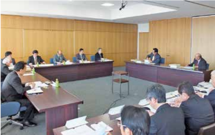
総務民生常任委員会の審議状況

予算審査は各議員が広く審議を行うことができるよう、常任委員会ごとの分科会方式により所管分の審査を行いました。各委員会での質疑・答弁等の主なものは次のとおりです。