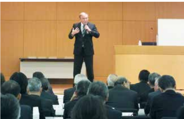
山形弁研究者 ダニエル・カール氏