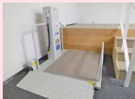
車いすでの傍聴も出来ます。