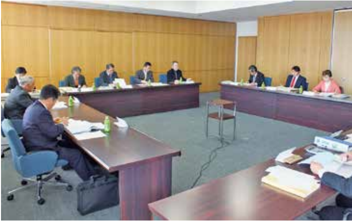
教育産業常任委員会の審議状況