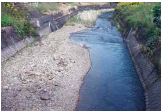
土砂の滞留した河川