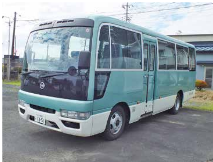
県から貸与されている避難用バス