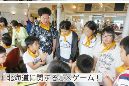
北海道に関する〇×ゲーム!