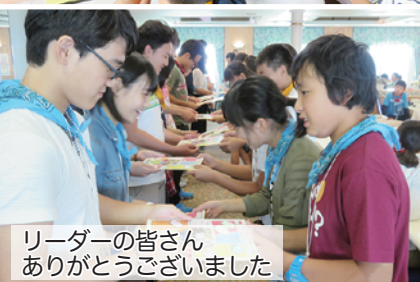
リーダーの皆さん ありがとうございました