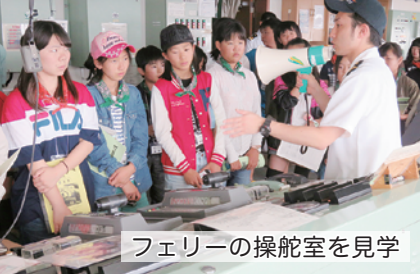
フェリーの操舵室を見学