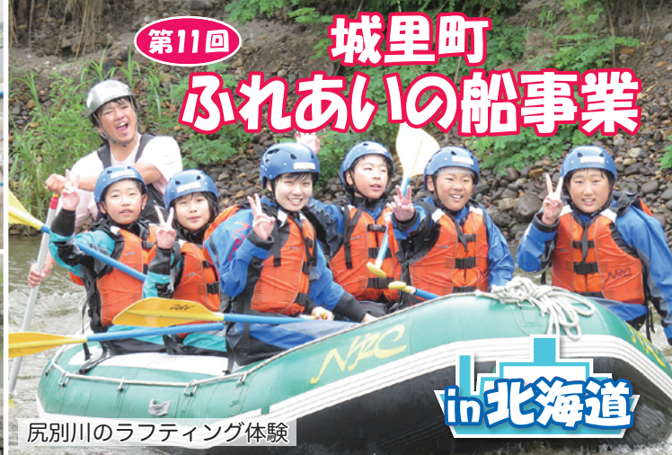
尻別川のラフティング体験