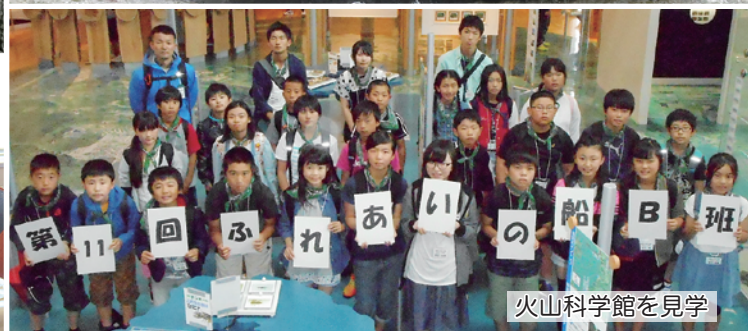
火山科学館を見学