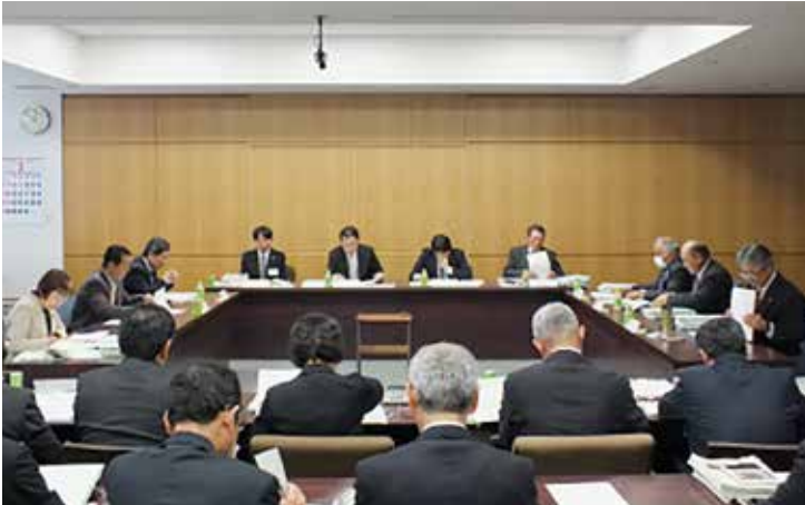
総務民生常任委員会

予算審査は各議員が広く審議を行うことができるよう、常任委員会ごとの分科会方式により所管分の審査を行いました。各委員会での質疑・答弁等の主なものは次のとおりです。