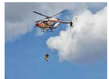
上空30メートルからの救助訓練