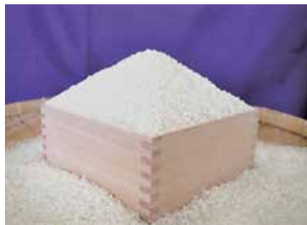
城里コシヒカリ「コケッコー米」

ランはあるか。 町長 ふるさと納税を活用し、町の農業を支えたい。加工品の商品開発等も応援したい。 （例として、返礼品のお米の出荷が1週間で5tぐらい）