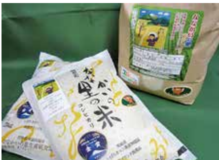
ななかの里の米「コシヒカリ」

町長 普通交付税額の特例措置終了で、合併10年が経ち、平成27年度から平成31年度にかけて、これから交付税が段階的に縮減される。効率的、効果的な財政運営を努めたい。 河原井 農業政策の具体的なプ