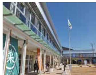
校舎：食堂、温浴・宿泊施設