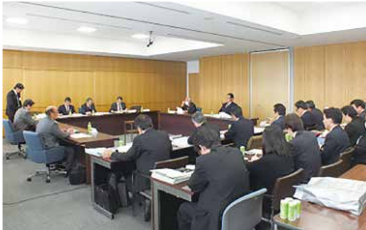
教育産業常任委員会

教育産業常任委員会は、会期中の3月11日に委員会を開催し、平成28年度一般会計予算の所管分・公共下水道事業・農業集落排水事業・水道事業会計の予算について審査しました。