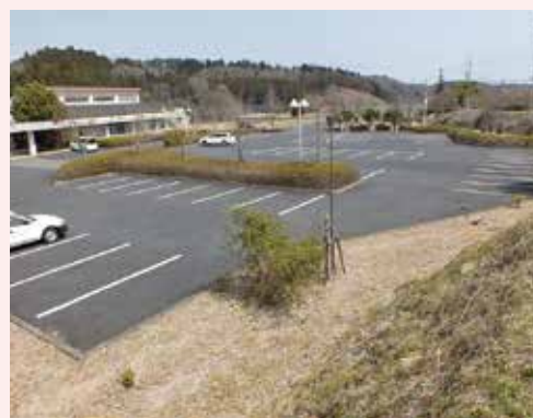
七会診療所建設予定地