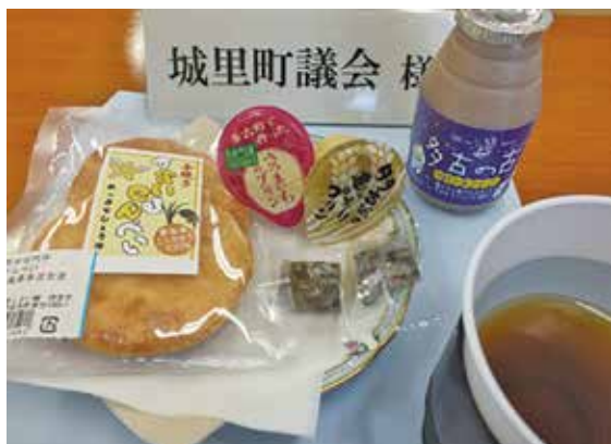
米やサツマイモの開発商品