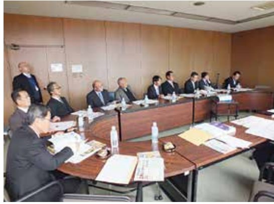
豪雨災害時の状況を聞く

概要 那須塩原市は、昨年9月の関東・東北豪雨により土砂崩れによる建物被害、河川の氾濫による建物浸水、また、基準雨量超過により国道道路の通行止め、土砂崩れによ