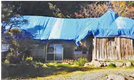
保存活用される城里町指定文化財

教育長 町として文化史跡として今回指定。その保存活用については、「専門家」「関係の方々」を含め組織を立ち上