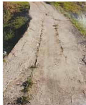
速やかな補修・改良が必要な道路

耳を傾け、救急病院等のない現在の城里町。緊急車両が速やかに通行できる道路の整備は非常に重要。積極的に補修や改良を進めたい。