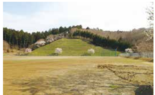
広々としたグラウンド

町長 ある程度ある程度と1億5千万円から2億5千万円ぐらいと見込んでいます。整備資金については、7割の交付税措置のある合併特例債を活用したい。またスポーツ振興くじtotoから助成金をいただけないかと思っている。仮に、2億5千万円かけるとして町の自己負担額は6千7百万円程度になる見込みだ。