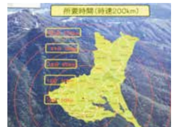
救助にかかる所要時間