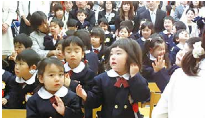
城里町の大切な子供たち

放射能被害に対する不安は大きい。その払拭は町政の義務であると思う。ちなみにエコー検査の財源は国の復興特別交付金で手当てされる。特定被災地方公共団体なら放射能濃度に関係ないとい国の担当者は答えている。財政的な懸念は必要ない。町長の決断を聞きたい。 町長 県内で9市町村が実施している。財政的負担が心配だったが、復興特別交付金で措置されるとなれば、研究していきたい。省令で100%措置が確認されればと思っ