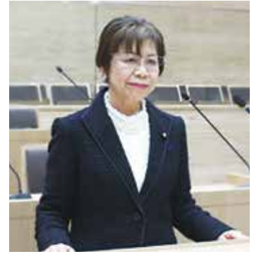
藤咲 芙美子 議員