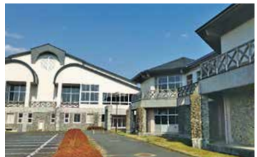
静まり返った空き校舎