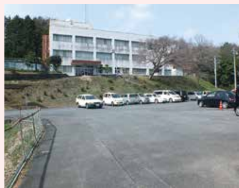
当初の建設予定地